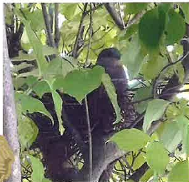
抱卵中のキジバト

その後、親鳥は時々巣を空けるようになりヒナが二羽いるのが確認できた。ある朝、家内が庭に蛇が出た！ヒナが襲われたら大変だと騒ぐ。さっそくホームセンターへ行き蛇忌避剤を購入、木の周りに散布する。この頃から夕方になると親鳥は、姿を見せなくなり夜はヒナだけで過ごす様になった。朝