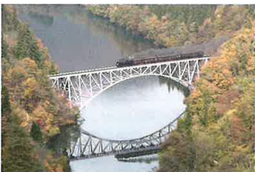
只見線鉄橋を通過する SL

目的の撮影場所は、鉄道ファン人気の只見線只見川の鉄橋と紅葉の撮影出来る場所である。早速カメラと三脚を担いで所定の高台へ急斜面を百メートル程登り、撮影場所に着く既には多くのカメラマ