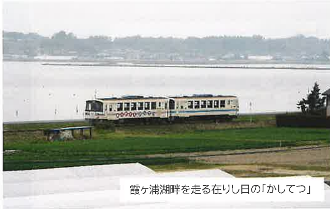
霞ヶ浦湖畔を走る在りし日の「かしてつ」