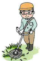
草刈作業時は防石ネットを使用の事!!