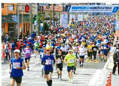
ガンバレ!! これから上りが続くぞ

全国から参加の約8000名のランナーや沿道応援者の安全確保のために、走路員スタッフとして役割を果たし、安全・安心な大会の実現のための一翼を担うことができました。