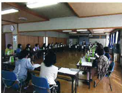
女性向け入会説明会