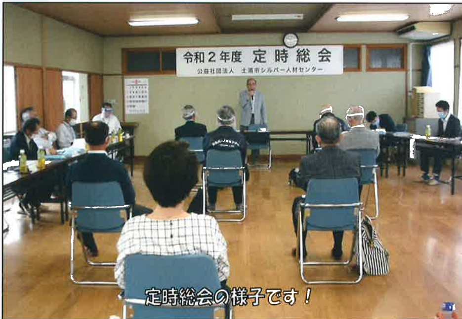
定時総会の様子です！

※今年の定時総会は、新型コロナウイルス感染症予防の観点から、書面等による議決権行使を認める異例の方法での開催となりました。