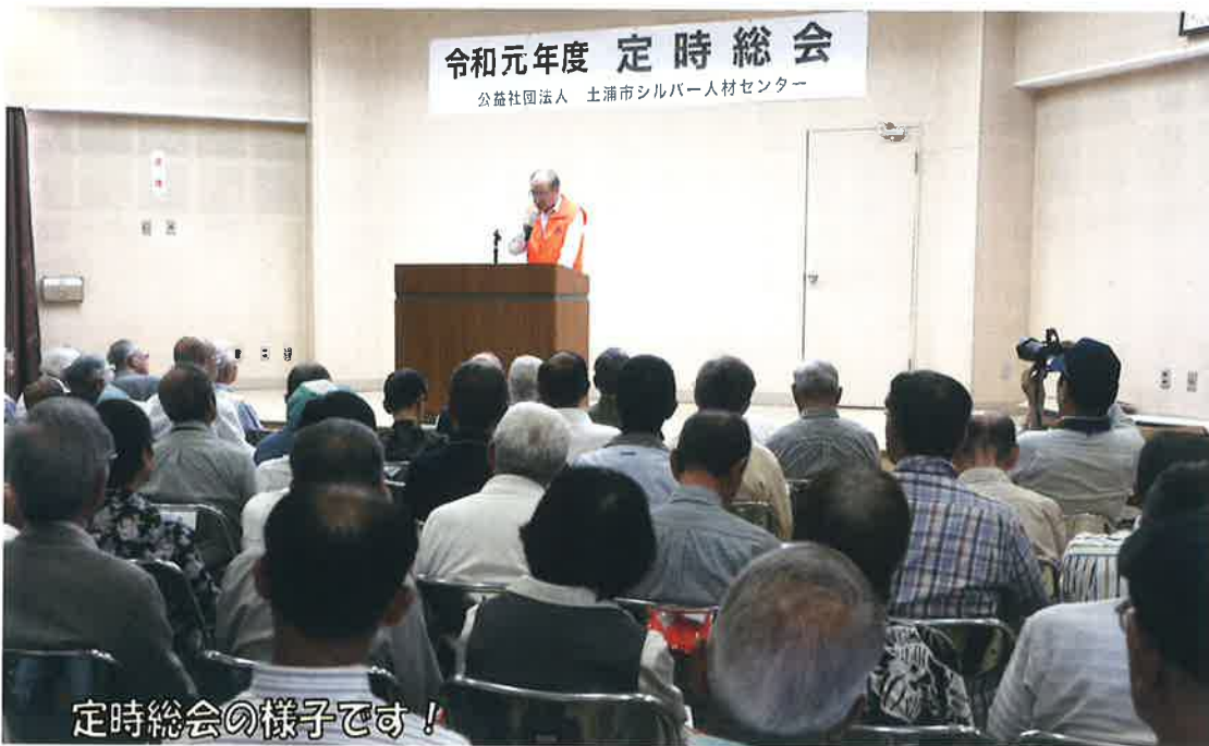
定時総会の様子です！